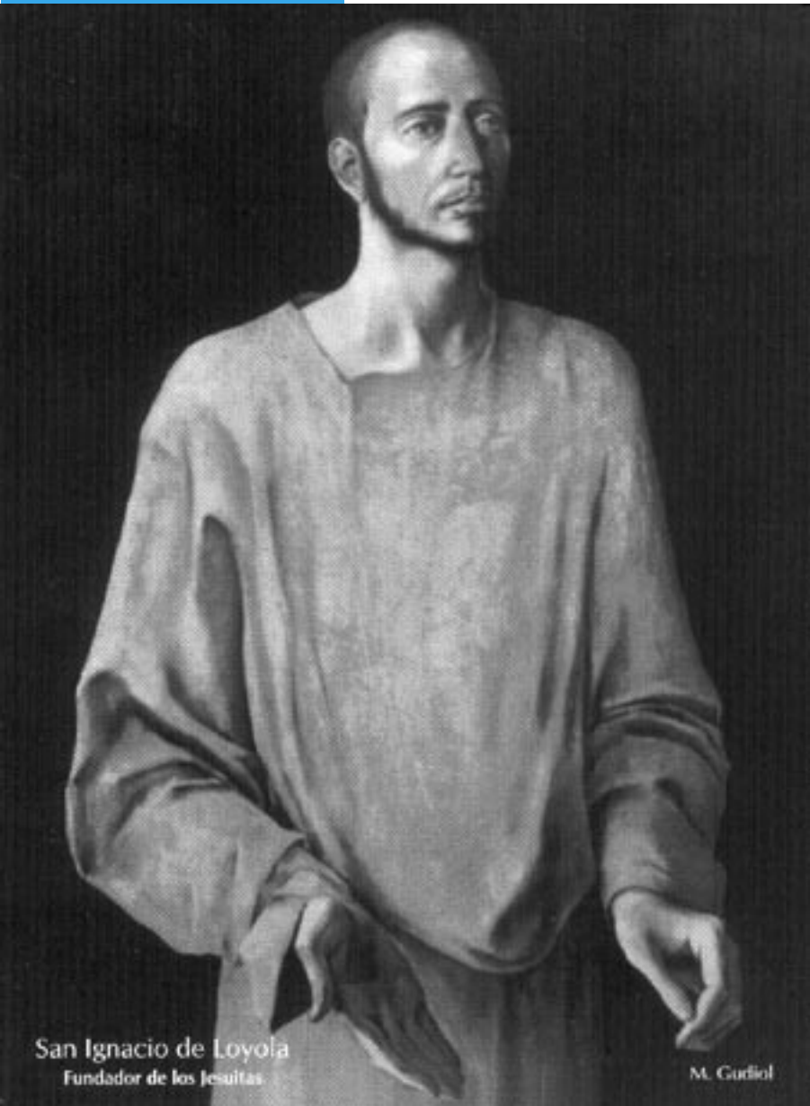
San Ignacio de Loyola Fundador de los Jesuitas