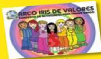
Arco iris de valores Cuaderno de actividades para Primer Grado Páginas: 168 ISBN: 978-980-7119-11-5