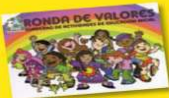
Ronda de valores Cuaderno de actividades de Educación Inicial Páginas: 132 ISBN: 978-980-6418-99-8