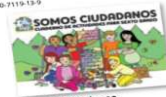
Somos ciudadanos Cuaderno de actividades para Sexto Grado Páginas: 160 ISBN: 978-980-7119-15-3