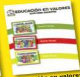
Educación en valores Guía para docentes de 4°-6° Páginas: 96 ISBN: 980-980-7119-16-0