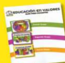
Educación en valores Guía para docentes de 1°-3° Páginas: 96 ISBN: 980-980-7119-16-0