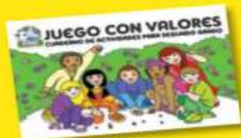
Juego con valores Cuaderno de actividades para Segundo Grado Páginas: 168 ISBN: 978-980-7119-10-8