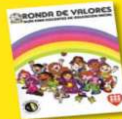
Ronda de valores Guía para docentes de Educación Inicial Páginas: 62 ISBN: 980-980-6418-98-1