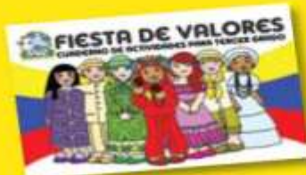
Fiesta de valores Cuaderno de actividades para Tercer Grado Páginas: 168 ISBN: 978-980-7119-12-2