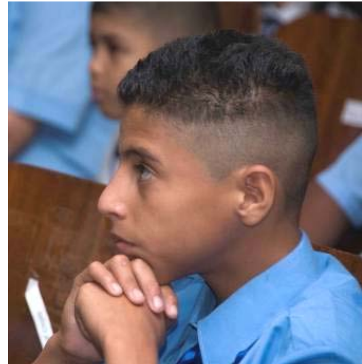
Acto de Graduación, julio 2008