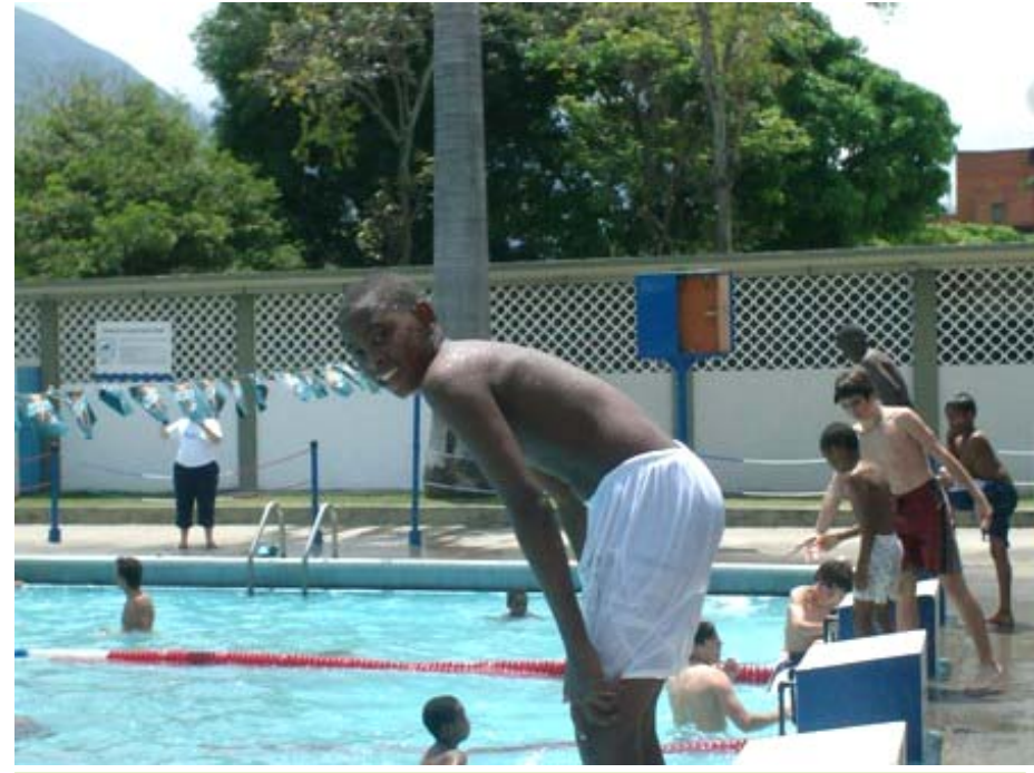
Piscinada en el CSI

De enero a marzo 2009, 14 alumnos del Colegio San Ignacio han completado 150 horas de servicio social directo en el barrio, y se han organizado en equipos dando clases un día a la semana durante un mes. Relevante ha sido que ellos mismos, han motivado a otros compañeros para que continúen la labor el mes siguiente.