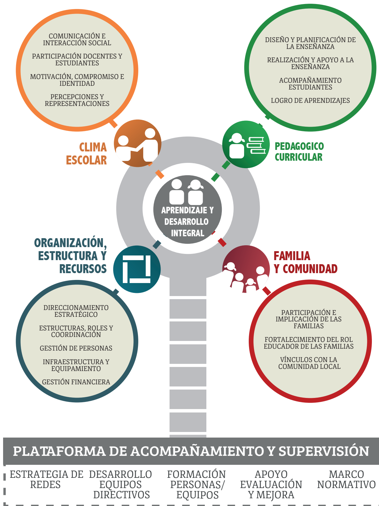
Figura 1: Estructura del Sistema de Calidad en la Gestión